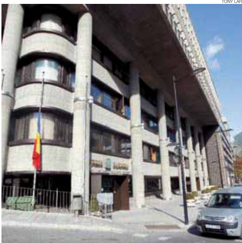
► L'edifici administratiu del Govern.

En una perspectiva prolongada en el temps, s'observa com durant el període 1999-2009 els ingressos van créixer a un ritme del 5% per any, mentre que les despeses ho van fer al 8,1%, que en termes globals suposen un creixement del 63% i del 118,3%, respectivament. Tal com assenyalava l'anuari, «aquesta diferència persistent comporta un augment, en línies tendencials, del dèficit pressupostari que ha anat creixent any rere any, consolidant l'endeutament bancari del Govern» en l'esmentada xifra. Cal destacar que el deute bancari no té en compte les obligacions de pagament als proveïdors i altres creditors, la qual cosa indica unes obligacions superiors a aquesta xifra. L'informe també as-