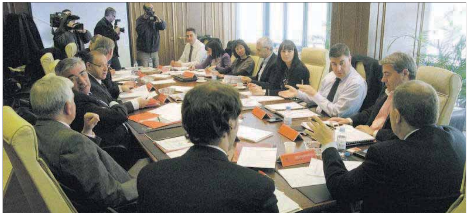
Els cònsols de totes les parròquies fan mans i mànigues per reduir les despeses vist que els ingressos minven.

El principi de suficiència financera va estretament lligat al d'autonomia. Aquest darrer concepte evidencia la relació que hi ha entre els recursos propis i els totals. Així, de manera global, l'autonomia financera comunal va ser del 62,3% el 2009. Força més de la meitat dels ingressos provenien de les fonts pròpies. Segons les dades recollides en l'esmentat anuari, en el període 1999-2009